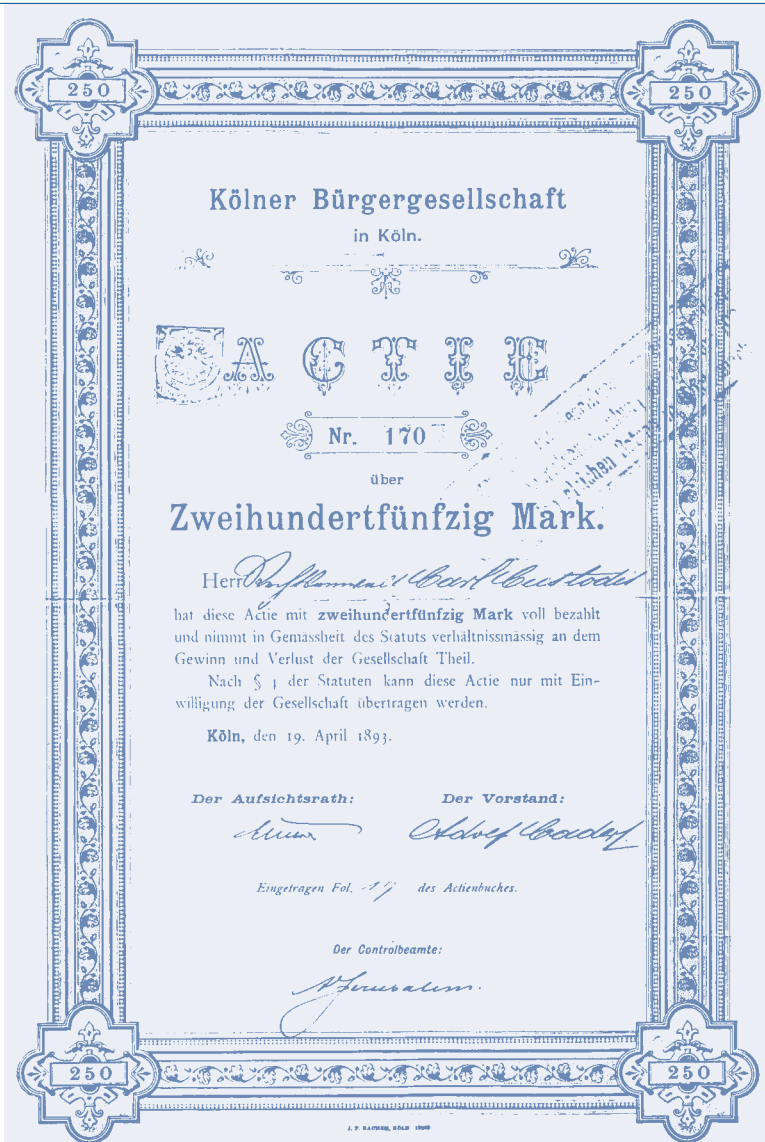
Aktie der Kölner Bürgergesellschaft AG von 1893