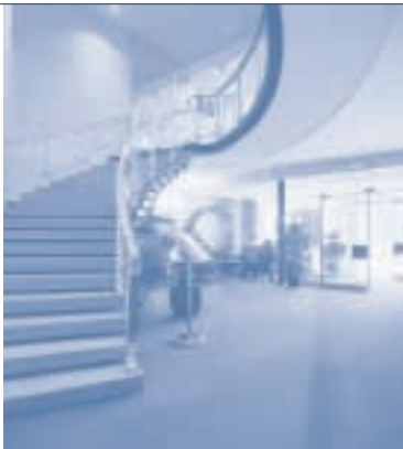
Das Foyer des Senats Hotels