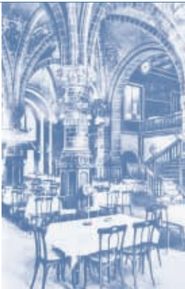
Restaurant: Ansicht mit Blick zum Gelben Zimmer im früheren Haus der Kölner Bürgergesellschaft AG

Die Sachanlagen sind zu Anschaffungs- oder Herstellungskosten, vermindert um planmäßige, nutzungsbedingte Abschreibungen bewertet. Geschäftsgebäude werden in längstens 50 Jahren, technische Anlagen und Maschinen in 5 bis 20 Jahren, andere Anlagen, Betriebs- und Geschäftsausstattung in 4 bis 25 Jahren abgeschrieben. Das Sachanlagevermögen wird ausschließlich nach der linearen Methode abgeschrieben. Geringwertige Wirtschaftsgüter werden im Jahr der Anschaffung voll abgeschrieben und in der Entwicklung des Anlagevermögens als Abgang behandelt.